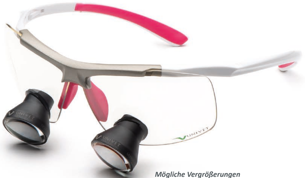
Mögliche Vergrößerungen Galilean: 2.5 X