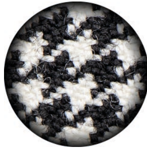
3.0 X Galilean PRO HD