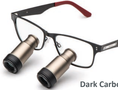
Dark Carbon Red Prismatic