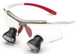
White Red Galilean