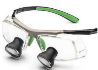
Black Green Galilean