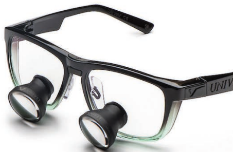
Emerald Cool Galilean