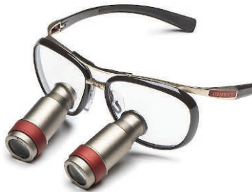
Endura Brown Prismatic