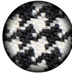
3.5 X Galilean PRO HD

Die prismatischen Vergrößerungssysteme XS ULTRA-HD sind so konzipiert, dass sie maximale Vergrößerung und perfekte Bildschärfe ermöglichen. In der Welt der Vergrößerungssysteme sind die Prismenlinsen Univet XS ULTRA-HD der Maßstab für höchste Auflösung, perfekte Kantenschärfe, außergewöhnliche Detailgenauigkeit und somit die ideale Lösung für Ärzte, welche mit der höchsten Vergrößerungsstufe arbeiten möchten.