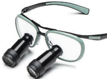
Green Vespa Prismatic