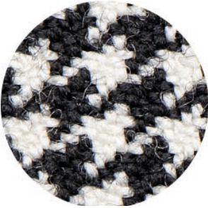
3.5 X Ergo Advanced