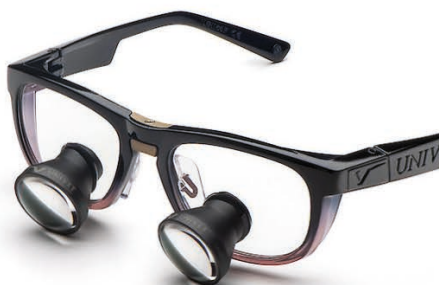
Ruby Look Galilean