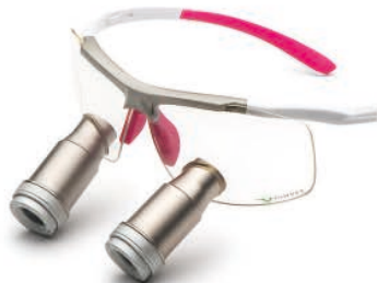
White Pink Prismatic