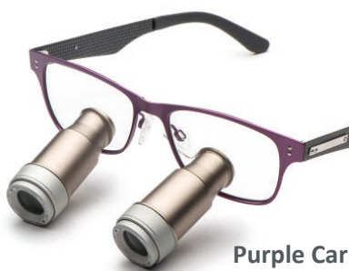
Purple Carbon Prismatic