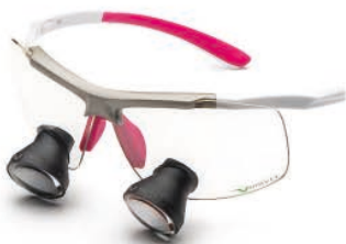
White Pink Galilean