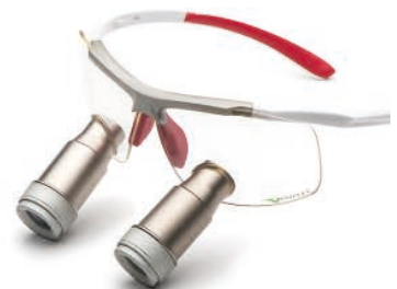
White Red Prismatic