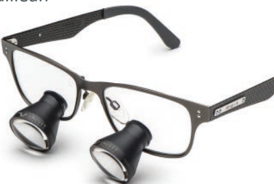
Carbon Grey Galilean