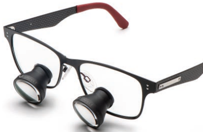
Dark Carbon Red Galilean