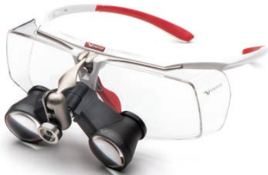
White Red Galilean

Die AIR X ist die beste Schutz-Lupenbrille, die je geschaffen wurde. Die Schutzgläser sind austauschbar und die Winkel der Okulare individuell einstellbar. Das Lupengestell kann auch über der eigenen Sehbrille getragen werden. Das Headgear-System bietet Ihnen eine flexible und bequeme Lupen-Konstruktion. Die Okulare sind in der vertikalen Achse sowie im Neigungswinkel individuell einstellbar. Auch das Headgear-System kann über der eigenen Sehbrille getragen werden.