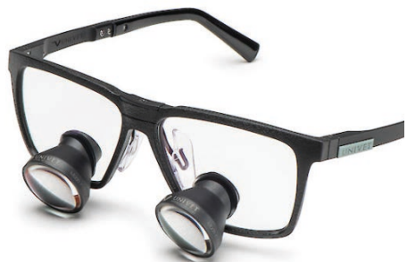
Black Edition Galilean