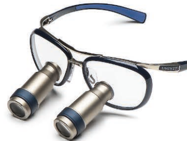
Midnight Blue Prismatic