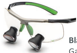
Black Green Galilean

Unsere Quick Loupe ist eine Lupenbrille, die für alle preislich attraktiv ist. Dank der Besonderheiten des eingesetzten optischen Systems ist diese Brille ad hoc verwendbar. Die Quick-Loupe ist in mehreren Varianten mit voreingestellten Parametern verfügbar. Dieses exklusive Modell ist ideal für diejenigen, die ein Vergrößerungssystem zum ersten Mal benutzen - mit allen Vorteilen und dem Komfort einer TTL Vergrößerung.