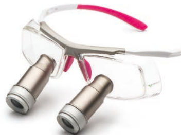
White Pink Prismatic