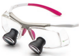
White Pink Galilean