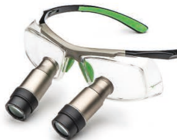
Black Green Prismatic