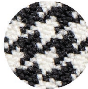
4.5 X Ergo Advanced