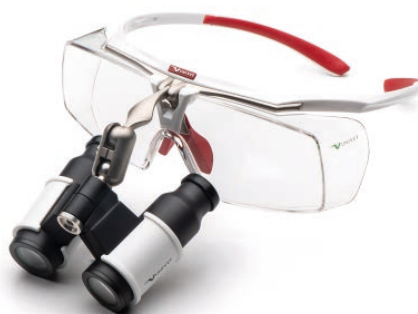
White Red Prismatic

Mögliche Vergrößerungen Prismatic: 3.5 X | 4.5 X | 6.0 X