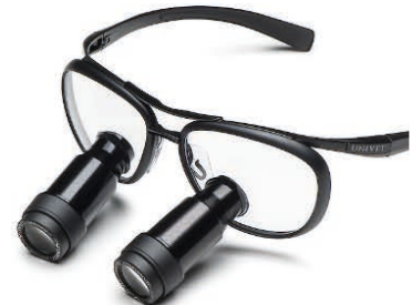
Black Edition Prismatic