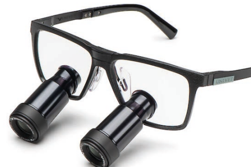
Black Edition Prismatic