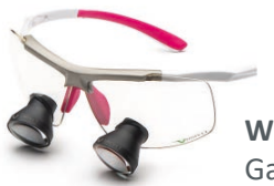
White Pink Galilean