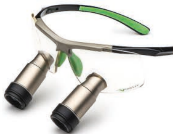
Black Green Prismatic