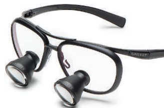
Black Edition Galilean