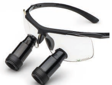
Black Edition Prismatic