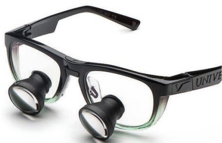
Emerald Look Galilean