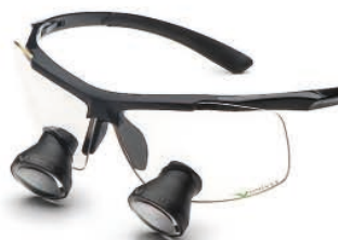
Black Edition Galilean