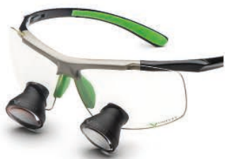
Black Green Galilean