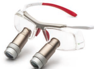
White Red Prismatic