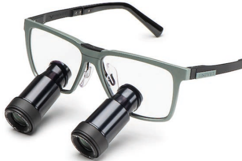
Desert Sage Prismatic