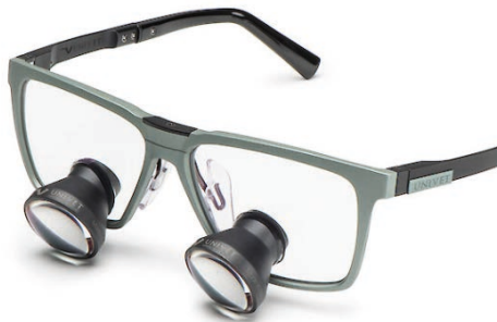
Desert Sage Galilean