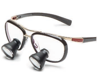
Endura Brown Galilean