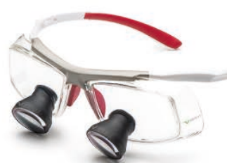
White Red Galilean