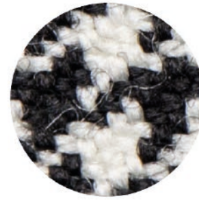
5.7 X Ergo Advanced