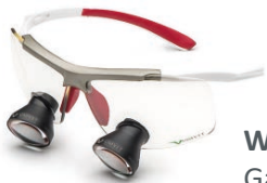
White Red Galilean