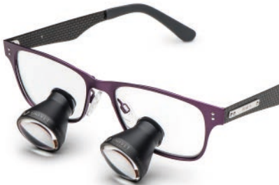
Purple Carbon Galilean