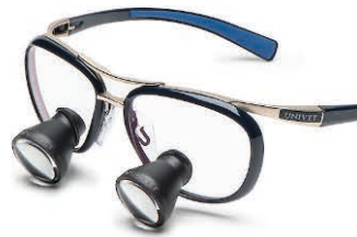
Midnight Blue Galilean