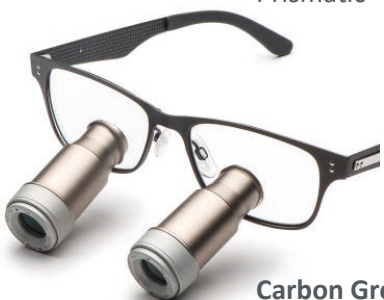
Carbon Grey Prismatic