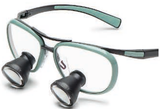
Green Vespa Galilean