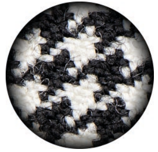
3.5 X Galilean PRO HD

Die prismatischen Vergrößerungssysteme XS ULTRA-HD sind so konzipiert, dass sie maximale Vergrößerung und perfekte Bildschärfe ermöglichen. In der Welt der Vergrößerungssysteme sind die Prismenlinsen Univet XS ULTRA-HD der Maßstab für höchste Auflösung, perfekte Kantenschärfe, außergewöhnliche Detailgenauigkeit und somit die ideale Lösung für Ärzte, welche mit der höchsten Vergrößerungsstufe arbeiten möchten.