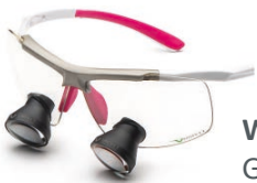
White Pink Galilean