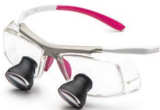
White Pink Galilean