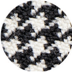
3.5 X Ergo Advanced