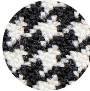
3.5 X Prismatic XS ULTRA-HD