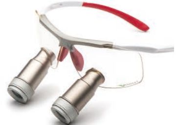
White Red Prismatic