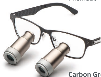
Carbon Grey Prismatic