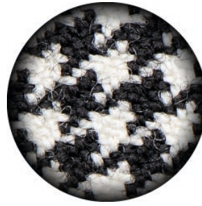
3.0 X Galilean PRO HD